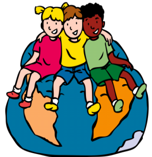
We horen bij elkaar

Ze leren over opstekers en afbrekers . Je geeft een opsteker als je een aardige, positieve opmerking over iemand maakt. "Jij kan zo goed iemand helpen". Opstekers doen iets met je; je wordt er bijvoorbeeld blij van. Het tegenovergestelde van een opsteker is een 'afbreker'. Het is een onaardige, negatieve opmerking over iemand. De ander krijgt er bijvoorbeeld een vervelend gevoel van. De kinderen leren dat iedereen zijn mening moet kunnen uiten en verdedigen en iedereen respect moet hebben voor de mening van anderen. Om de sfeer direct goed neer te zetten hebben de kinderen de eerste twee weken iedere dag een Vreedzame Schoolles. Bij de andere blokken hebben de kinderen iedere week één les.