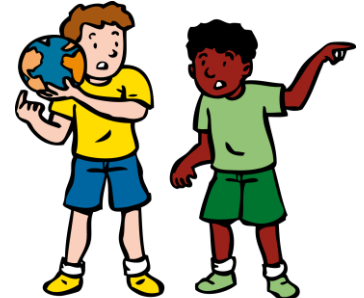
We lossen conflicten zelf op

Doel: kinderen leren om op een positieve manier met conflicten om te gaan. Overall waar kinderen met elkaar spelen en werken komen conflicten voor. Met De Vreedzame School leren we de kinderen dat conflicten heel normaal zijn en dat ze bij het leven horen. Wat belangrijk is, is hoe je er mee omgaat. Hoe los je op een positieve manier conflicten op? Hoe zorg je ervoor dat beide partijen tevreden zijn met de oplossing? Een conflict hoeft niet uit te monden in ruzie. We spreken van ruzie wanneer het ene kind wil winnen ten koste van het andere kind. Eén partij is dan tevreden, de andere partij is de verliezer.